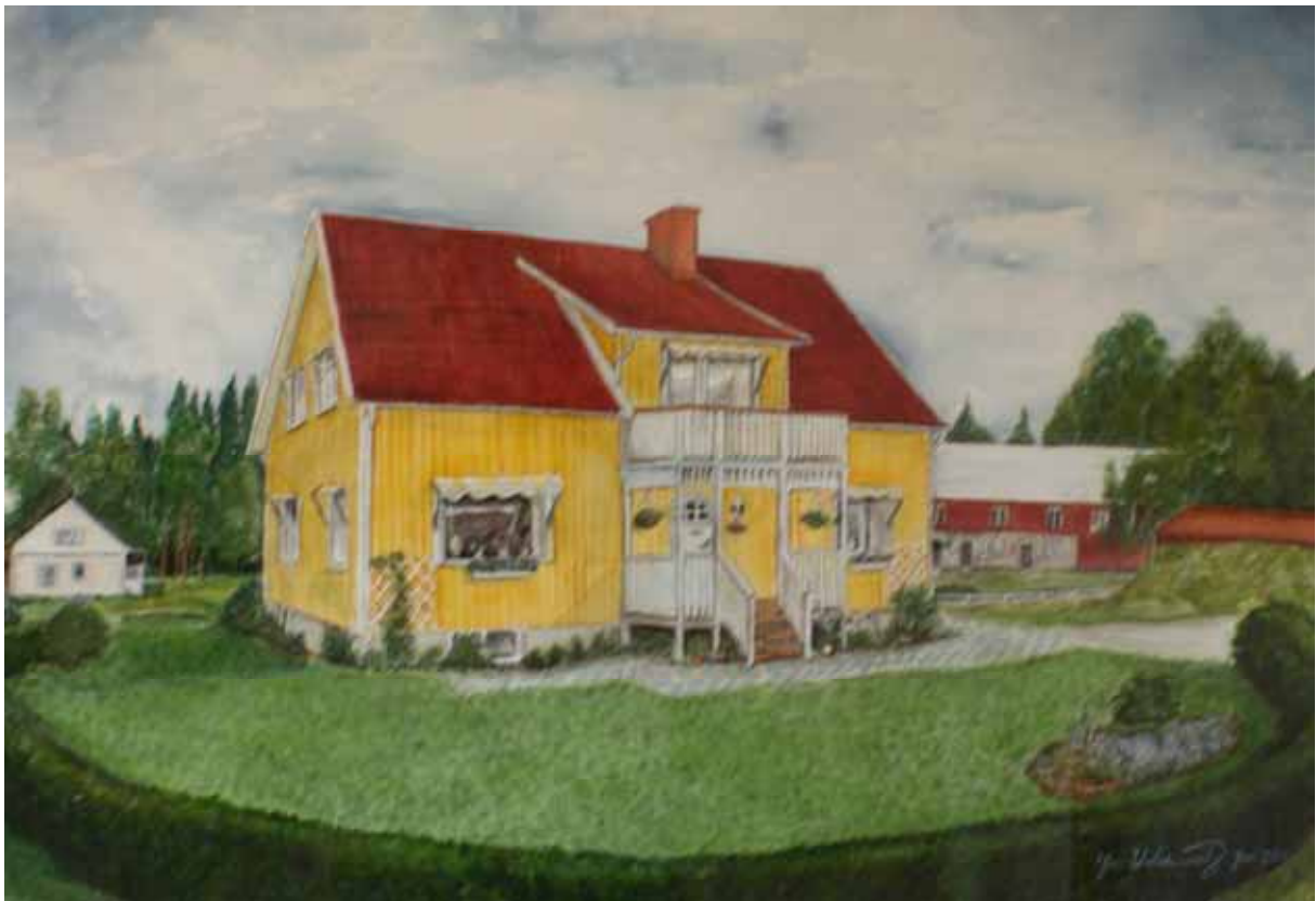
Gårdsmålning från 2004.