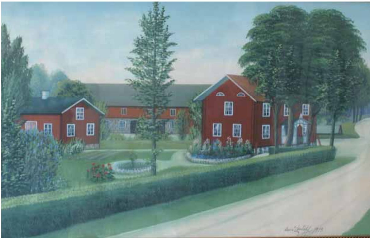
Gårdsmålning från 1913